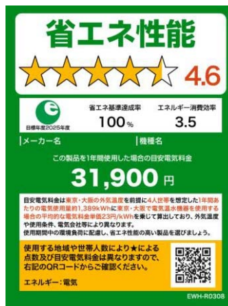
(電気温水機器のイメージ)

※温水機器以外は、製品のサイズやネット取引等の限られたスペースで使用する場合は右側のミニラベルを活用すること。