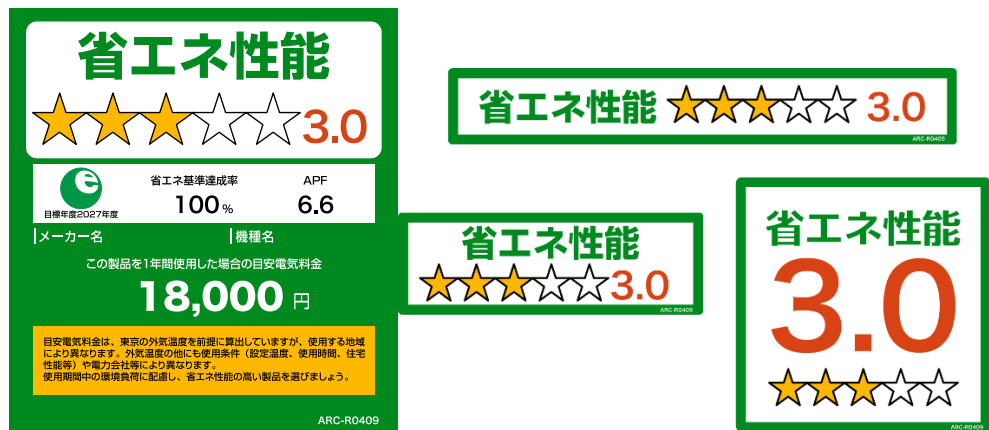
(家庭用エアコンディショナーのイメージ)