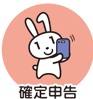
確定申告 (2024年度より)