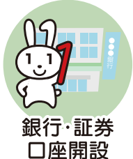
銀行・証券 口座開設