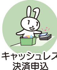
キャッシュレス 決済申込