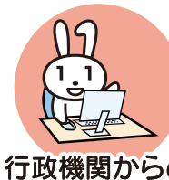
行政機関からの お知らせ・各種証明書