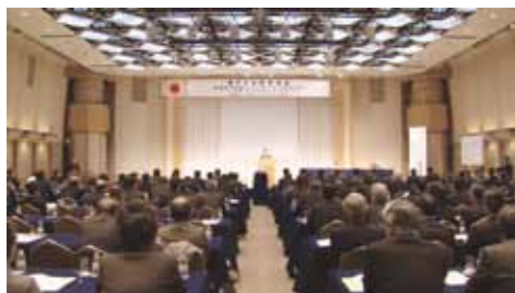
リネンサプライセミナー